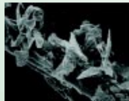
Pêlos de animais